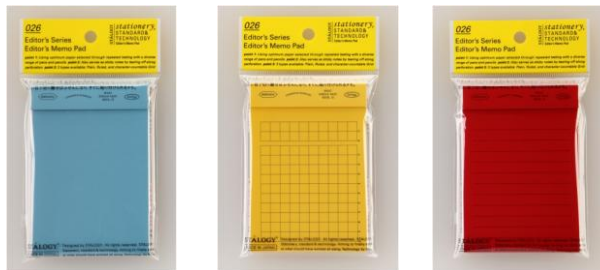
S3070 無地 S3071 グリッド S3072 罫線