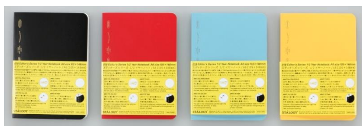
1/2 イヤーノート ブラック・レッド・ブルー・イエロー