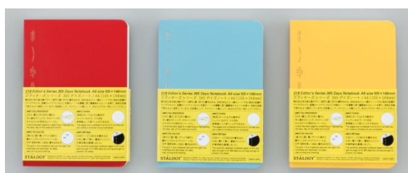
365 デイズノート レッド・ブルー・イエロー